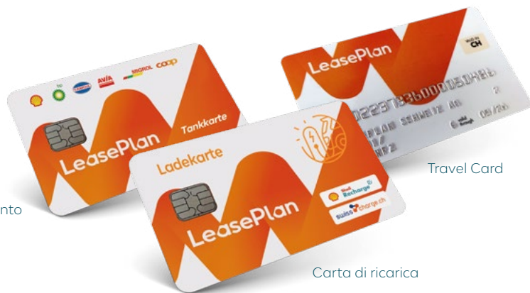
Carta di rifornimento